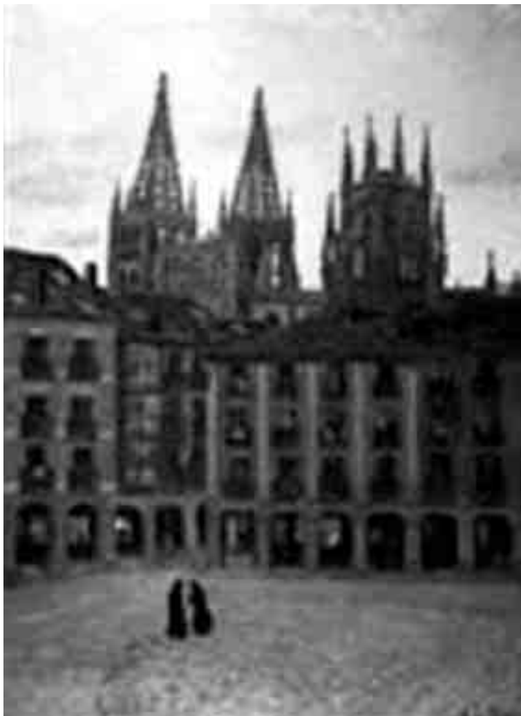
D. REGOYOS, LA CATEDRAL DE BURGOS AL AMANECER , 1906

rista cretense pasado por la escuela de Venecia, que según Cossío escribiese en la biografía histórica y estudio que haría sobre el pintor, se habría españolizado supuestamente, integrando en sus estilos bizantinizante y veneciano un carácter españolizador, en la etapa en que se identificó con el misticismo y con