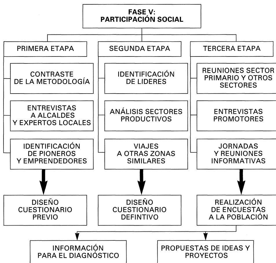
FIG. 2.—Proceso de Participación Social correspondiente a la Fase V del modelo.

Se recomienda realizar el proceso de participación social por etapas de forma que se comience por una primera aproximación mediante consultas con los responsables de la promoción del desarrollo, Expertos locales, Pioneros, Líderes y Alcaldes de los municipios integrantes. En etapas posteriores se mantendrán reuniones y entrevistas en profundidad con la población al objeto de conocer su opinión sobre el entorno, y recoger propuestas que sirvan de base para la definición de estrategias de desarrollo. También se pueden entrevistar a expertos locales para determinar de forma objetiva el análisis de la Capacidad e Impacto de las actividades territoriales seleccionadas.